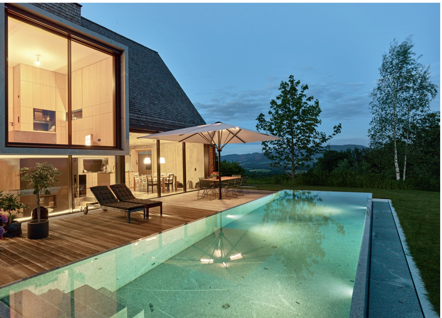
Die Pool-Scheinwerfer sind in den massiven Granit eingearbeitet.